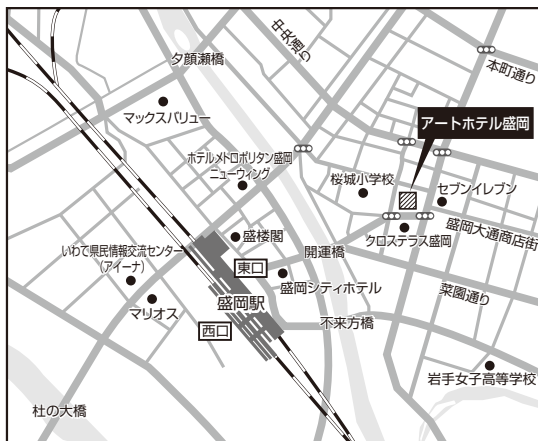
■盛岡会場：アートホテル盛岡