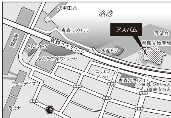
■青森会場：青森県観光物産館アスパム

【アクセス】○JR仙台駅西口 徒歩2分 ○JR仙石線「あおぼ通」 徒歩5分 ○地下鉄南北線「広瀬通」 徒歩5分